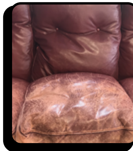
Usura da utilizzo del divano