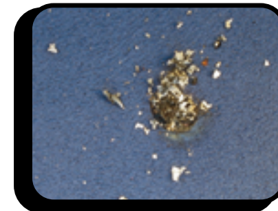
Bruciatura di sigaretta