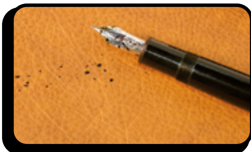
Macchie di inchiostro