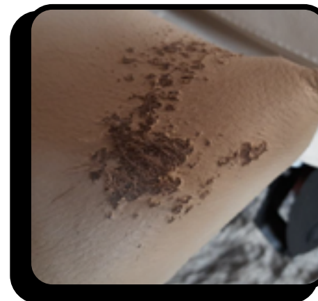
Graffi e strappi diffusi