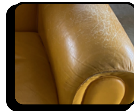
Negligenza da mancata manutenzione

Questa è soltanto una sintesi, per i dettagli completi delle fattispecie escluse dal Servizio di Protezione, vedere il contratto di servizio.