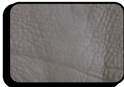
Basso di fiore (caratteristica naturale delle pelli)