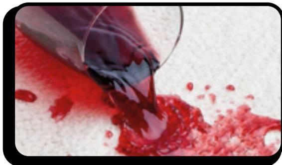
Bevande (caffè, vino, etc.)