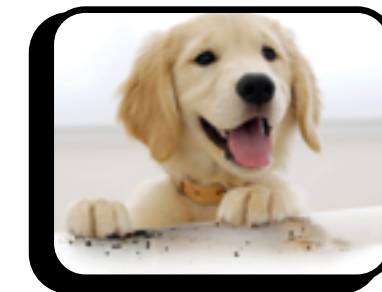
Impronte di animale

La protezione è disponibile per imbottiti in pelle o tessuto e per i meccanismi . Questa è soltanto una sintesi, per i dettagli completi della copertura, vedere il contratto di servizio.