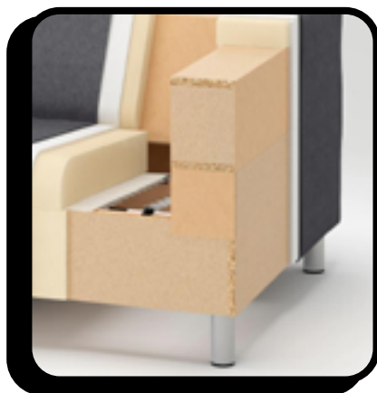
Struttura in legno, parti metalliche